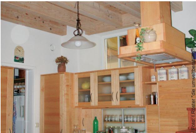
Aus Küche, WC und Badezimmer wird die verbrauchte feuchte Luft abgesaugt