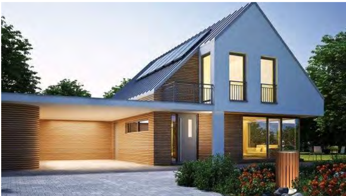
Moderne Wärmepumpen sind leise, stylisch und kaum noch als technisches Gerät erkennbar

Außenluft-Wärmepumpen sind kostengünstig in der Anschaffung. Sie werden insbesondere im Neubau und bei sehr guten Sanierungen empfohlen. Sie sind etwas weniger effizient als Grundwasser- oder Erdreichsysteme, aber fossilen Heizsystemen mit Erdgas oder Heizöl als Energieträger in puncto Klimaverträglichkeit und CO 2 -Emission haushoch überlegen. Durch eine gute Planung können störende Geräusentwicklungen während des Betriebs vermieden werden.