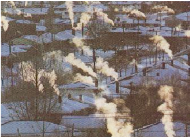
... als Geld und Schadstoffe beim Schornstein rausblasen!

Bei den Anfangsinvestitionen stehen geringere Kosten durch den Wegfall von Heizanlage und Heizkeller den Zusatzkosten für Lüftungsanlage und Wärmedämmung gegenüber. Der erhöhte Wohnkomfort lässt sich monetär nicht ausdrücken. In den nächsten Jahren ist durch Serienfertigung der notwendigen Komponenten (Fenster, Haustechnik) mit weiteren Preisreduzierungen zu rechnen.