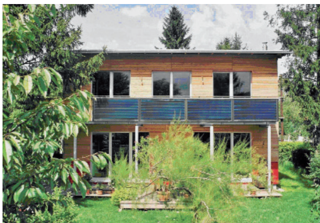
Besser viel dämmen und wenig heizen...

Ein Niedrigenergiehaus braucht viel weniger Heizwärme als ein Gebäude, das nur dem thermischen Mindeststandard der Bauordnung entspricht. Energiesparende Bauweise erfordert einen kompakten Baukörper, die Ausrichtung nach Süden, eine sehr gute Wärmedämmung, gut dämmende Fenster und eventuell eine Lüftungsanlage mit Wärmerückgewinnung.