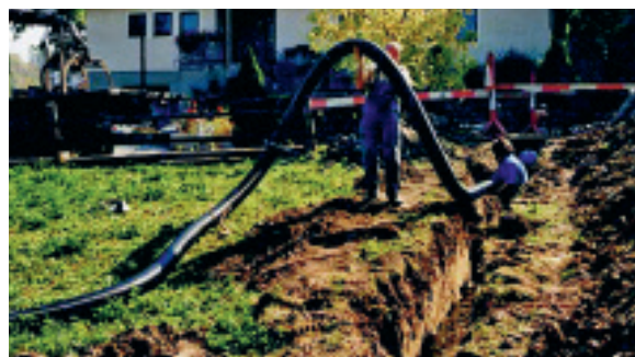
Erdverlegte Nahwärmeleitung vor dem Zuschütten der Künette