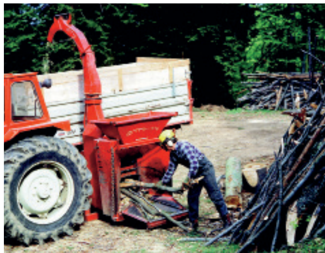
Brennstoffproduktion im Wald

Die Versorgungssicherheit wird durch eine intelligente Lagerhaltung sichergestellt. Moderne Anlagen zeichnen sich durch höchste Betriebssicherheit und Zuverlässigkeit aus. Für den Fall der Fälle sind Ausfallsicherungen im System und im Liefervertrag vorgesehen.